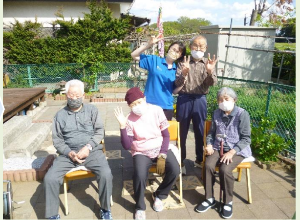
外が気持ちいい季節になりましたね〜