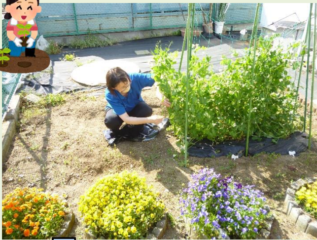
スナップエンドウときぬさやを植えました