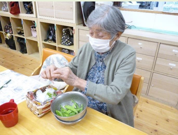
すじを取っていただき味噌汁やおやつのおまけにいただきました