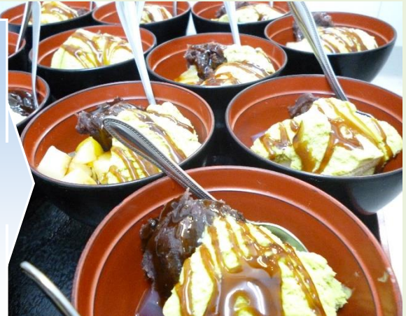
ささら特製の大人気 クリームあんみつです つておいしいですよ〜 寒天