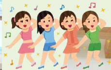
今流行りのプリンバンバンを 踊ってみました(o^ー^o)ニコ